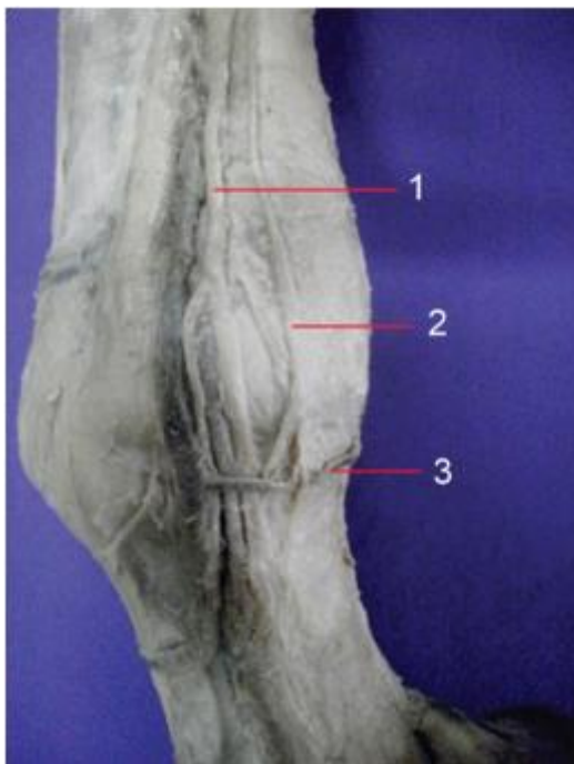
Figura 2. Disección nervios palmares. Mano izquierda, vista lateral

Referencias: U : Nervio ulnar, M : Nervio mediano, 1; rama palmar de U , 2; rama medial de M , 3; rama lateral de M , 4; nervio palmar lateral, 5; nervio palmar medial, 6; rama comunicante, 7; nervio digital palmar lateral, 8; Nervio digital palmar medial.