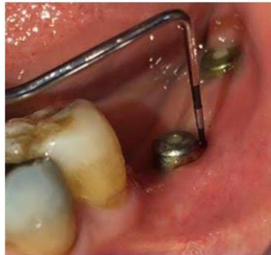
Figura 3. Visita de seguimiento de 1 mes. Valor de la profundidad de sondeo: 3 mm.

supuración durante el procedimiento (Figura 3). Actualmente, tras un año de seguimiento mensual, la profundidad de la bolsa se mantiene en 3 milímetros.