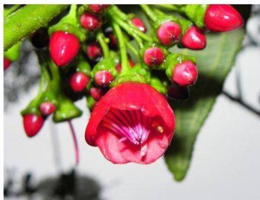
Figura 4. Flor de M. sanguinea , se observa la corola y los estigmas.