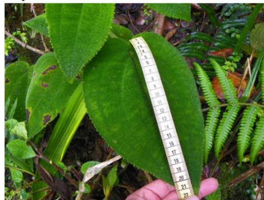
Figura 3. Detalle del haz del espécimen encontrado.

setulosas) (Figura 3). Envés moderado a densamente setuloso sobre las venas, con gruesos pelos 0.1-0.3 mm de largo, 7-9 nervadas. Las vénulas en el envés ligeramente elevado-reticuladas; pecíolos 3 4-8 cm de largo, en el ápice con un par de gruesos apéndices deflexos 2-4 mm de largo. Panículas estrechas, 18-45 cm de largo; flores numerosas, 5-meras, sobre ramitas cortas laterales; pedicelos 8-12 mm de largo, bractéolas inconspicuas. Hipantio oscuro y caducamente furfuráceo, 2.7-3 mm de largo; cáliz 1.2-1.5 mm de largo, esencialmente entero, dientes externos callosos, inframarginales. Pétalos carmesíes profundo o rojo profundo, apenas extendiéndose 11-12 × 9.5-12 mm, glabros. Estambres isomorfos, filamentos 6-6.2 mm de largo, tecas 6.5 mm de largo; conectivo con un diente dorso-basal romo, 2-2.9 mm de largo, apéndice dorsal romo, 0.8 mm de longitud (a veces obsoleto) (Figura 4). Ovario 5-locular, glabro, algo (0.2-0.3 mm) deprimido en el ápice.