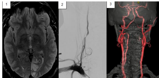
Paciente masculino de 42 años de edad. (1) RMN de cerebro: Lesión hiperintensa en Flair cortico-subcortical occipital izquierda. (2) Arteriografía por sustracción digital: estenosis severa del segmento V2 de la AV derecha, hipoplásica, secundaria a disección. (3) AngioTC: ausencia del flujo de la AV derecha en su tercio inferior y flujo filiforme distal.

anterógrada favorable. Se indica doble antiagregación (AAS 100 mg + clopidogrel 75 mg) + rosuvastatina 40 mg, se agrega quetiapina por alucinaciones visuales y topiramato por cefalea diaria. Evoluciona favorablemente en controles posteriores.