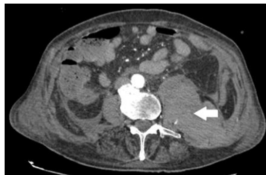
Figura 1. Tomografía axial computada de abdomen y pelvis, corte axial: se observa colección hemática retroperitoneal, en topografía del músculo psoas izquierdo y espacio pararenal posterior izquierdo.

Hacia el sexto día de internación, el paciente evoluciona con signos clínicos compatibles con shock hipovolémico asociado a descenso abrupto de hemoglobina en control de 2 horas (6.2 mg/dl a 5.4 mg/dl). Se solicita tomografía de abdomen y pelvis con contraste endovenoso, la cual reveló importante colección hemática retroperitoneal, en topografía del músculo psoas izquierdo y espacio pararenal posterior izquierdo (Figura 1). Se decide traslado a Unidad de Terapia Intensiva realizándose una angiografía de arteria lumbar izquierda (L2, L3) con posterior embolización endovascular de urgencia.