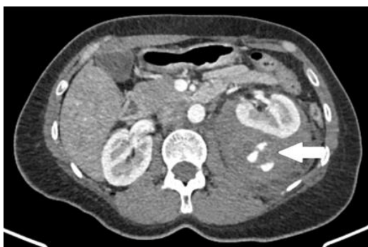
Figura 3. Tomografía de abdomen y pelvis con contraste endovenoso: angiomiolipoma izquierdo conocido complicado con sangrado activo e

Se realizó vía periférica y analgesia con ketorolac y dexametasona sin respuesta; se solicitó laboratorio que evidenció: hemoglobina= 9.4 mg/dl, VCM= 74 y HCM= 22.9, pH 7.23, pCO 2 61.6 mmhg, bicarbonato 25.5 y ácido láctico 4.1, con resto de analítica normal, y nueva tomografía de abdomen y pelvis con contraste endovenoso donde se evidenció angiomiolipoma izquierdo conocido complicado con sangrado activo e importante hematoma en espacio pararenal posterior, con un volumen aproximado de 250 cc (Figura 3). Por dichos hallazgos se dió aviso al servicio de Urología, quien decide conducta quirúrgica de urgencia, con requerimiento de 2 unidades de glóbulos rojos sedimentados y 3 unidades de plasma fresco congelado. Se realizó nefrectomía izquierda bajo anestesia total, con un tiempo quirúrgico de 151 minutos en total, emergiendo complejizada con drenaje de lecho quirúrgico y sonda vesical. Evolucionó de forma favorable y con adecuado manejo del dolor con goteo de fentanilo, cursando postquirúrgico inmediato en Unidad de Terapia Intensiva y luego en sala común donde se descomplejizó de forma paulatina. Se otorgó alta institucional al quinto día de internación por buena evolución y estabilidad hemodinámica.