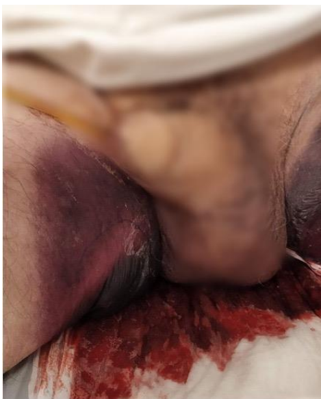
Figura 3. extensión hacia genitales.