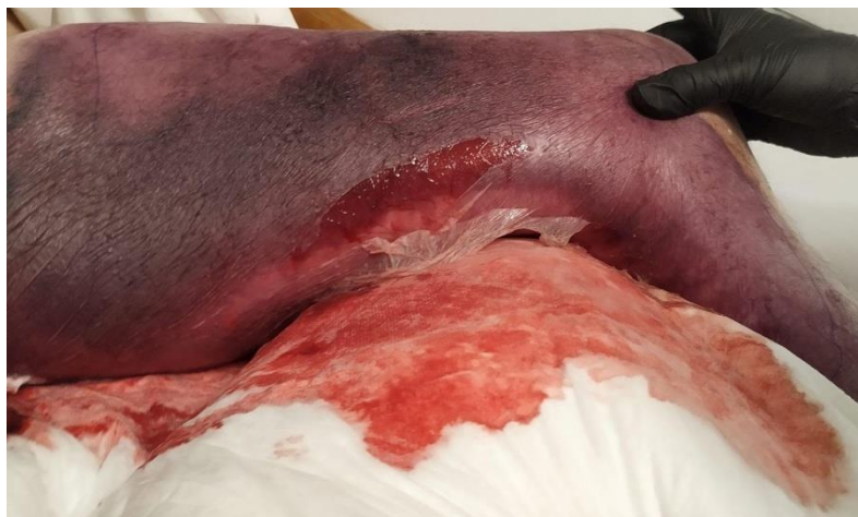
Figura 4. Necrosis cutánea extensa y formación de flictenas hemorrágicas en zonas de apoyo.