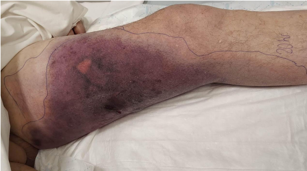
Figura 1. Placa violácea localizada en cara interna de muslo izquierdo con bordes difusos (demarcada a las 20hs) y edema que compromete todo el miembro.