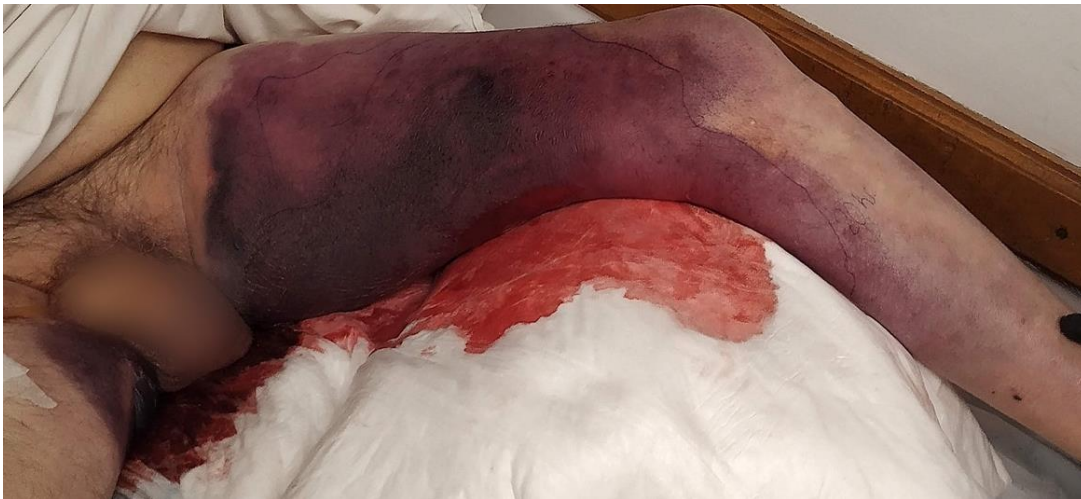
Figura 2. Avance de la lesión con compromiso de la totalidad del miembro, extendiéndose hacia el contralateral.