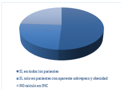
Figura 1. Cálculo del IMC en pacientes de 2 a 5 años, inclusive.

Respecto al cálculo del Índice de masa corporal en niños de 2 a 5 años, inclusive, de los pediatras que realizaron un curso o entrenamiento en sobrepeso y obesidad el 70% declaró calcular el IMC en todos los pacientes, mientras que aquellos que no realizaron un curso o entrenami-