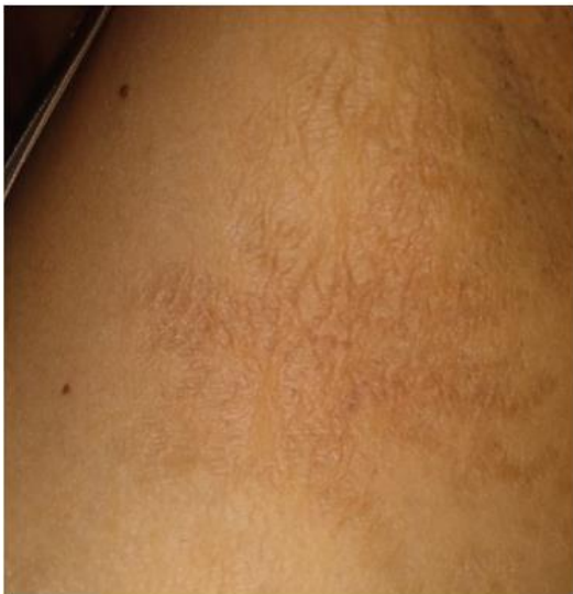
Figura 1. Arrugas que se extienden desde axila izquierda hacia mama, piel “en papel de cigarrillo”

asintomáticas y aparecieron meses previos a la consulta, aumentando lentamente en cantidad y extensión. Los diagnósticos presuntivos son: pseudoxantoma elástico, pitiriasis versicolor, elastolisis de la dermis media, linfoma cutáneo de células T, paraqueratosis granular y estrías. Se realiza biopsia incisional de piel afectada cuyo estudio anátomo-patológico con hematoxilina-eosina informa cambios inflamatorios superficiales no específicos. Con tinción de orceína se evidencia disminución y fragmentación de fibras elásticas a nivel de la dermis media, respetando región papilar y reticular, hallazgos compatibles con elastolisis de la dermis media (Figura. 4).