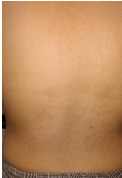
Figura 3. ligeras depresiones en piel de región lumbar.