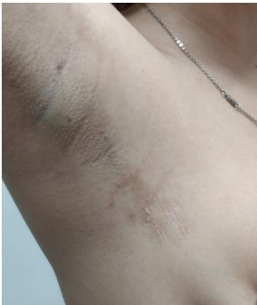
Figura 2. Axila derecha, finas arrugas parduzcas.