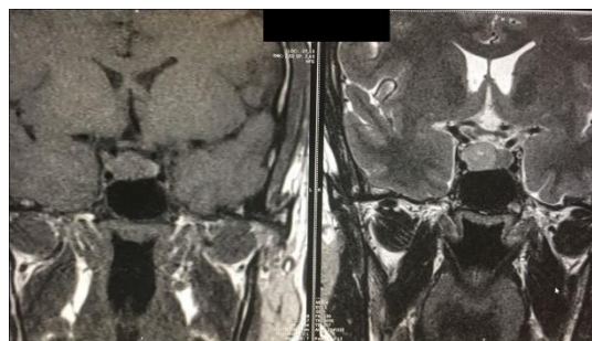
Figura 1: IRM de hipófisis con gadolinio.

Resto de perfil hipofisario normal. Se indica propanolol 40mg/día. Se realiza cirugía con exéresis de adenoma de hipófisis vía transeptoefenoidal, con buena evolución postquirúrgica y descenso de hormonas tiroideas periféricas hasta alcanzar un valor de T3 115ng/dl, T4L 1,11ng/dl al mes postquirúrgico. Anatomía patológica: Adenoma hipofisario productor de TSH (tirotropinoma). (Figura 2) El paciente presenta recrecimiento de cabello, evoluciona asintomático.